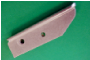
Replacement Blocks for new serilor® CUT (SQ-06)

FIMOR propone una nueva herramienta hecha especialmente para el corte fácil y perfecto de toda tira de hule o plastica de un espesor máximo de 10mm.